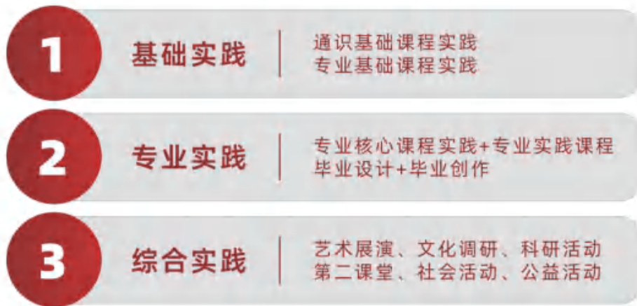
图 2-2 实践教学体系